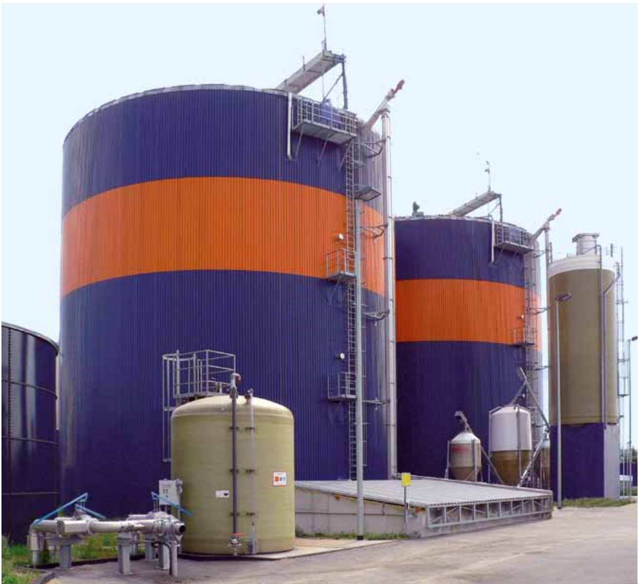
Abb. 1: Greengasanlage Rathenow, Brandenburg [3]

serstoffentfernung aus Abwassersammlern mit Eisensalzen besonders bewährt [1, 2]. Diese Technologie wird seit vielen Jahren auch erfolgreich für die Entfernung von Schwefelwasserstoff in Biogasanlagen genutzt.