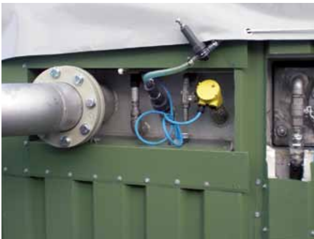
Abb. 2a und b: Mögliche Eisensalz-Dosierstelle in die Substratleitung (oberes Bild) und direkt in den Fermenter (unteres Bild).